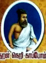
சுறள் நெறி காப்போம்!